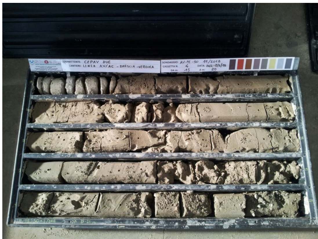
SONDAGGIO AV-PE-SO-11/18 – Cassa n.4 da 15.00 m a 20.00 m