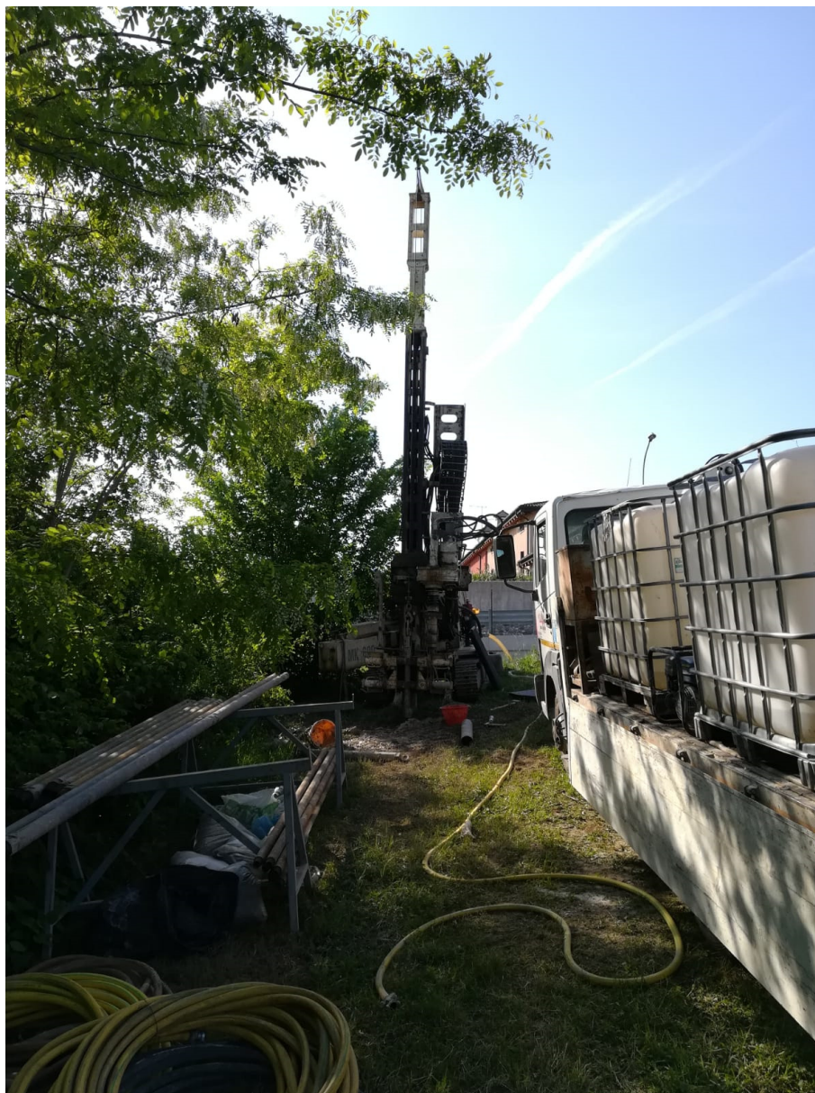
SONDAGGIO AV-PE-SO-11/18 – Postazione