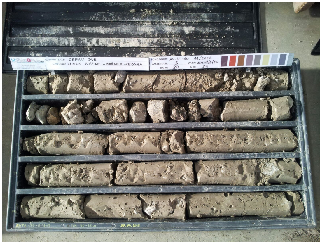
SONDAGGIO AV-PE-SO-11/18 – Cassa n.5 da 20.00 m a 25.00 m