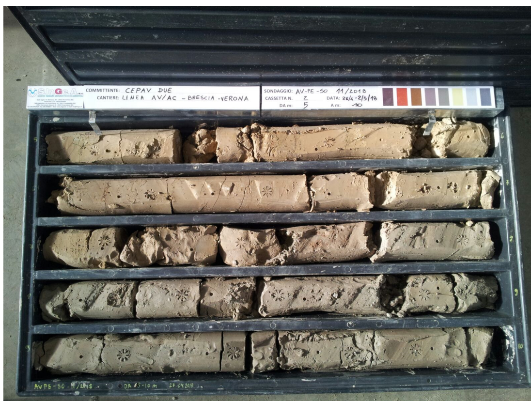
SONDAGGIO AV-PE-SO-11/18 – Cassa n.2 da 5.00 m a 10.00 m