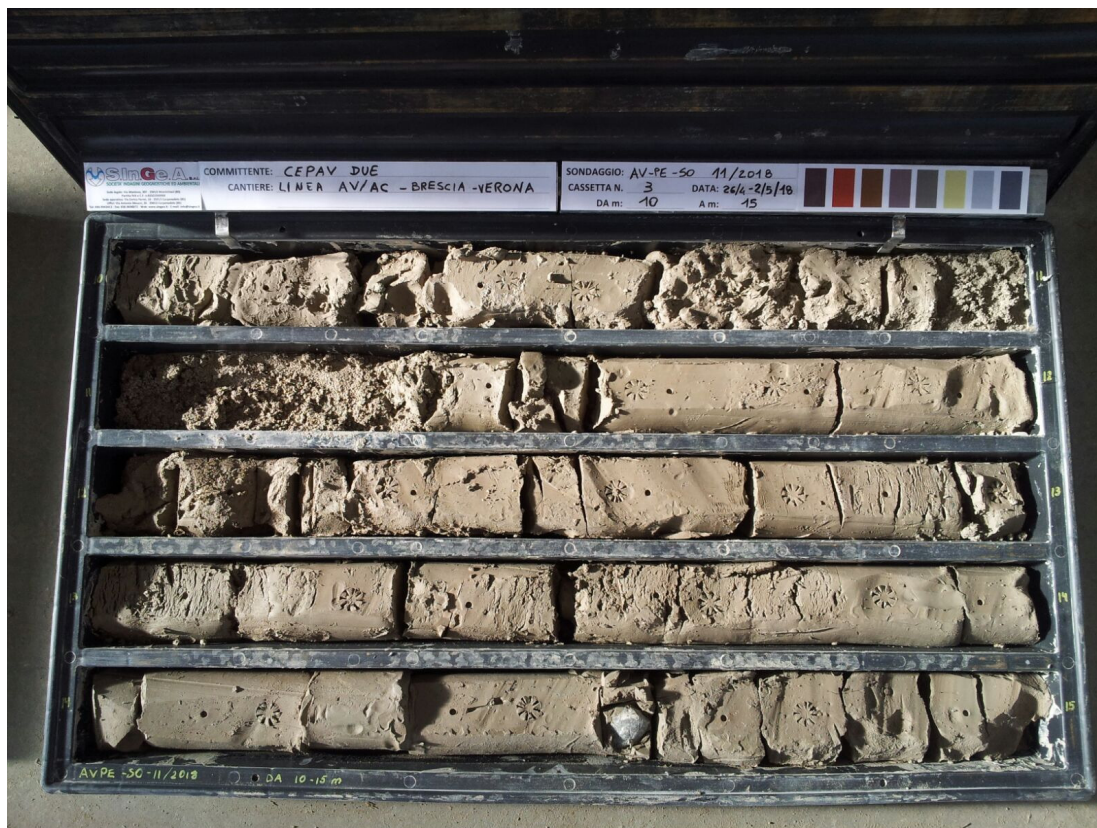
SONDAGGIO AV-PE-SO-11/18 – Cassa n.3 da 10.00 m a 15.00 m