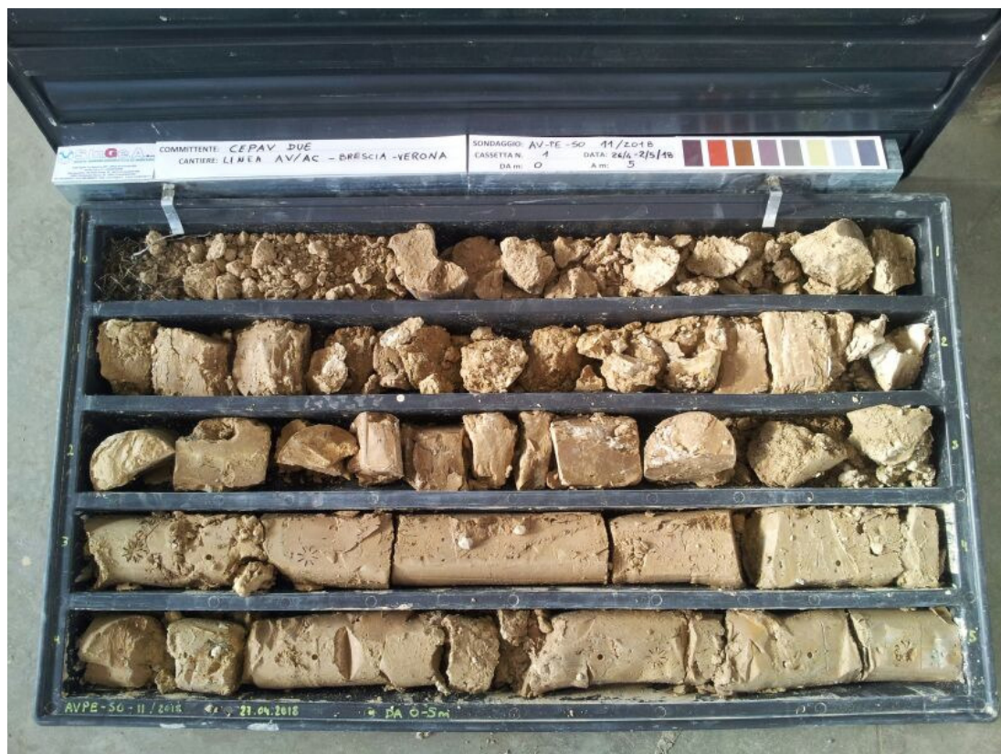
SONDAGGIO AV-PE-SO-11/18 – Cassa n.1 da 0.00 m a 5.00 m